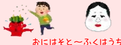
おにはそと～ふくはうち～