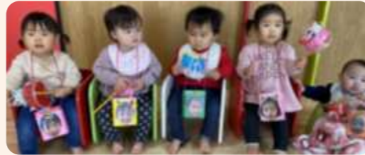
おにさん作ったよ～