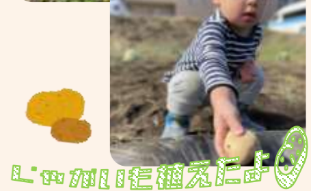
ゆきつめたいを植えるよ！