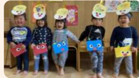
みんなでやっつけるぞ(´ー´)